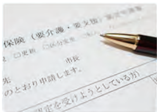
要介護認定申請代行