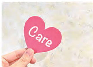
各サービス事業所との 連絡調整

お客様が希望する生活を送れるようになるためには、介護保険サービスの利用支援だけでなく、多様な福祉サービスや自治会、地域のボランティア団体などの取り組みも組み合わせていく必要があります。