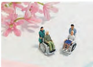
介護に関するご相談